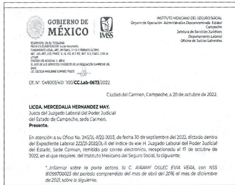
Figura 1: Proyección oficio IMSS

ordenó girar al Instituto Mexicano del Seguro Social, por lo cual se procede a proyectar en la pantalla, a efectos de desahogar los puntos ofrecidos en esta prueba: