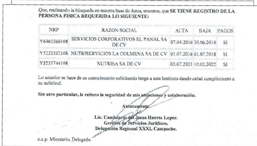
Figura 6: Informe oficio INFONAVIT