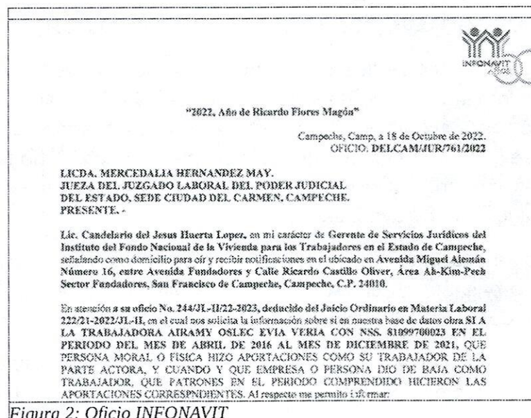
Figura 2: Oficio INFONAVIT